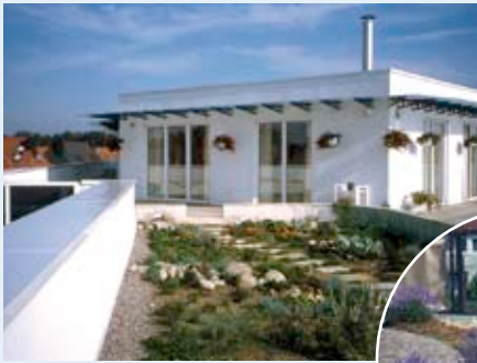
Bürohaus Kohn, Wunstorf