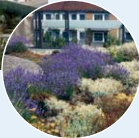
IBM Deutschland GmbH, Hannover

Begrünte Dachflächen sind heute wahrlich keine Neuheit mehr – klar, dass Sie über die Technik im Großen und Ganzen Bescheid wissen. Fest steht, heute sind die Möglichkeiten, Dachflächen architektonisch ganzheitlich einzubinden, größer als je zuvor.